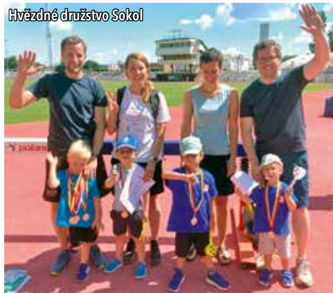
Hvězdné družstvo Sokol

V době konání Sokolského Brna probíhaly na Julisce atletické závody pro nejmenší děti od 2 do 7 let. Hodnocení je nastaveno tak, aby co nejvíce dětí mohlo získat medaili. A opravdu, všechny děti z naší jednoty si ze závodů odnesly minimálně jednu medaili, některé i čtyři, a navíc celé družstvo získalo první místo