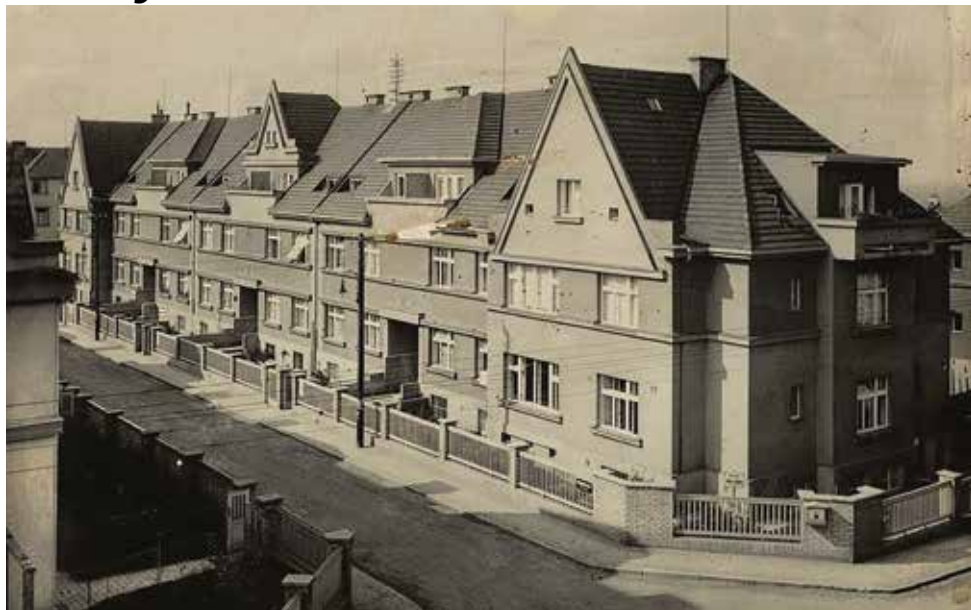
Foto z první poloviny minulého století