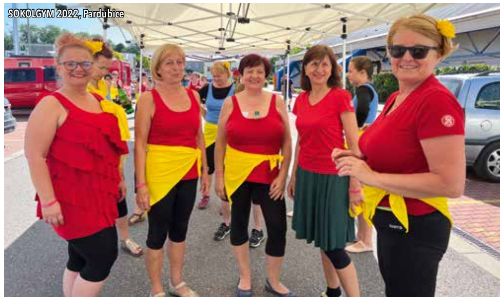
SOKOLGYM 2022, Pardubice