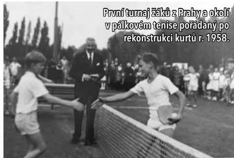
První turnaj žáků z Prahy a okolí v pálkovém tenise pořádaný po rekonstrukci kurtů r. 1958.

Jak se daří klubu v současnosti? Uvažovalo se prý i o stavbě nové haly?