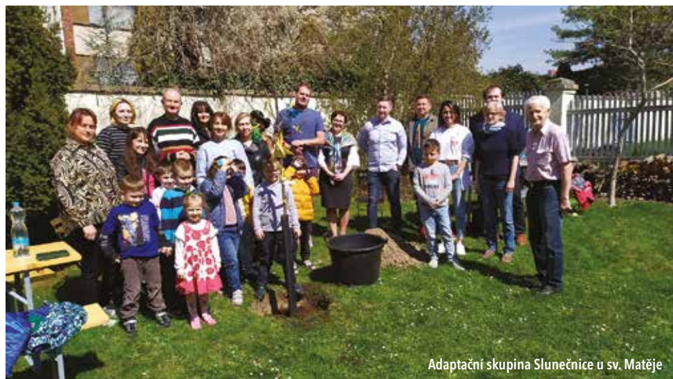
Adaptační skupina Slunečnice u sv. Matěje