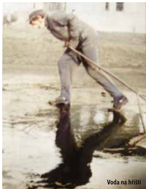
Voda na hřišti