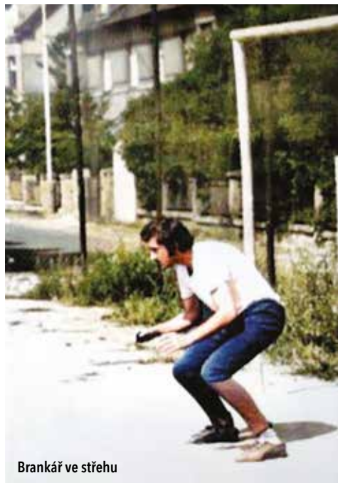
Brankář ve střehu

Od meziuličních soubojů lokálních part na tehdy četných nezastavěných parcelách se brzy dospělo k plošnému srovnávání úrovně jednotlivých uličních týmů (Spartak Míčanka, 1.FC Baba 1970, AC Fišerka, Pečkaři, FC Kodymka atp.), v tehdejší Pečkárně (školní zahrada a veřejný park, dnes pozemek bývalého hotelu Praha) a pak nejčastěji na malém hřišti Na Zavadilce (dnes zástavba). Postupem času přibývalo týmů s místními i světovými názvy mezinárodního fotbalu (Chelsea, Inter, Peňarol aj.) a turnajů, jejichž četnost rostla, se účastnilo i přes 10 týmů po 4 hráčích v poli. Hrál se stále častěji, přijížděli i mimohanspaulští soupeři a začínaly se objevovat i originální názvy týmů (velmi