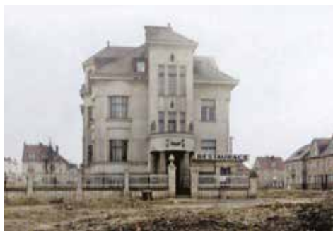
1928 - restaurace Na Pískách

Majitelé domu se v roce 1933 rozhodli, že provedou rekonstrukci. Venkovní terasu zastřešili a zbudovali tzv. „zasklenou terasu“ o ploše 100 m 2 (dnes