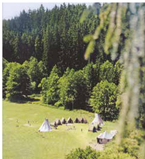
1989 - chlapecký tábor

Před sokolovnou stálo tee-pee, uvnitř probíhalo čtení z historie střediska, promítaly se filmy, konala se prohlídka klubovny, dokonce jsme měli i módní přehlídku toho „co se tehdy ve skautu nosilo“ a hlavně se setkávali ti, co spolu měli možnost leccos zažít. Oslavy probíhaly celý den, mezi dospělými se pohybovaly děti se současných oddílů.