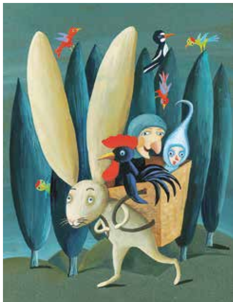
Z knihy Ježibaba na koloběžce , Jiří Kahoun, Euromedia 2015

Život v téhle malé pražské čtvrti byl tehdy odlišný nejen od dnešního, ale i od tehdejšího „městského“. Hanspaulka byla malým světem, který existoval sám pro sebe. Do mého dětského světa velkoměsto pod kopcem neproniklo. Čtvrť byla plná krámků a kypěla životem. Moje babička používala prvorepublikové názvy. Na Pískách byly potraviny Odkolek, prodejna Meinl s krásnými původními mahagonovými regály, o dva domy dál knihkupectví a nedaleko hned dvě prodejny s ovocem a zeleninou. V místech bývalé pizzerie se prodávalo galanterní zboží, naproti stála cukrárna U Kubánků, mandl, a dokonce i rybárna a také můj nejmilější obchod – papírnictví. Běžné věci tu člověk snadno obstaral, nebylo zapotřebí Hanspaulku vůbec opouštět.