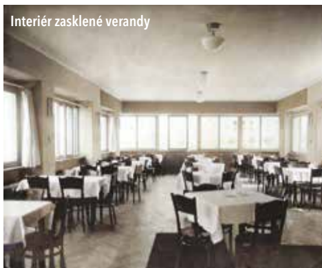
Intériér zasklené verandy