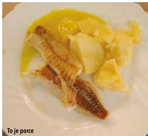
To je porce