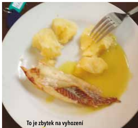
To je zbytek na vyhození

umělé přípravky ani dochucovadla, vaří se pouze z čerstvých potravin.