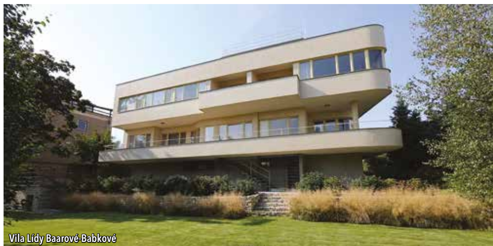
Vila Lídy Baarové-Babkové