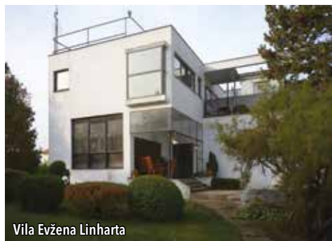
Vila Evžena Linharta

1926, definitivní plány pocházejí z roku 1927, vila byla zkolaudována roku 1929.