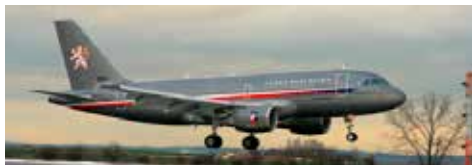
Dopravní letoun Airbus A 319, nesoucí jméno „Generál Janoušek“