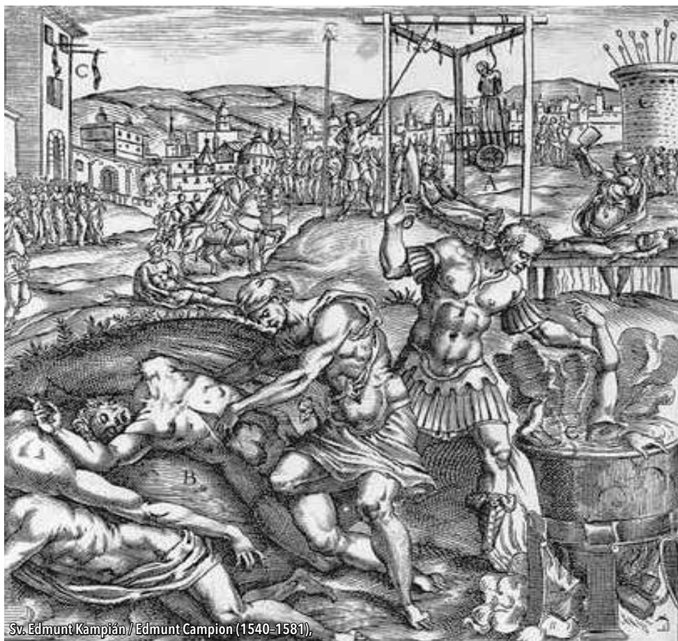
Sv. Edmunt Kampaň / Edmunt Campion (1540–1581),

se svým mladším bratrem Arnoštem vyslán na výchovu ke španělskému dvoru. Zde si prošel komplexním dvorským vzděláním a seznámil se s celou škálou světských i církevních metod uplatňování moci. Je známo, že přílišná krutost španělských inkvizičních procesů citlivého Rudolfa spíše odpuzovala, než oslňovala. To se spolu s dalšími faktory začalo později projevat v jeho snaze vládnout více rozumem než silou, formou aktivní podpory kultury, umění, vědy či alchymie na úkor stavění pranýřů, nebo šibenic a hranic.