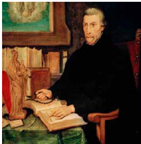
Sv. Petr Canisius / Peter Kanis (1521–1597), zakladatel Jeziuitské koleje v Klementinu nazvané po něm Canisium.

Dalším – a pro naši „matějskou tradici“ svým způsobem signifikantním – krokem papeže Pavla III. ve věci integrity víry a přezkumu falešných či chybných nauk, bylo založení Kongregace římské inkvizice (Congregatio Romanae et universalis inquisitionis). Stalo se tak 21. července 1542 a tento úřad v pozměněné podobě působí coby nejstarší kongregace papežské kurie