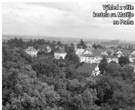
Výhled z věže kostela sv. Matěje na Prahu

Naším cílem nebyla však jen vyhlídka, ale i prohlídka věže samé včetně zvonů. Nejprve jsme se v kostele rozdělili do dvou skupin, přičemž první skupina vzápětí pochopila, proč to bylo nutné. K varhanám lze vystoupit po celkem pohodlném schodišti, i když dva proti sobě jdoucí se musí hodně přitisknout ke zdi, aby se navzájem vyhnuli. Od varhan, kde jsme si mohli trochu vyzkoušet pocit zde pravidelně vystupujících muzikantů (profesionálů či amatérů, většinou však dobrovolníků), jsme zase z jiné perspektivy než zdola viděli rokokový hlavní oltář s obrazem ještě z dříve zde stojícího kostela. Odsud už vedlo úzké dřevěné schodiště s úzkými schůdky a s otevřenými průhledy. Výstup nebyl vysoký, ale obtížnému poslednímu úseku museli věnovat zvýšenou pozornost i ti z nás, kteří se zabývali či zabývají horolezectvím.