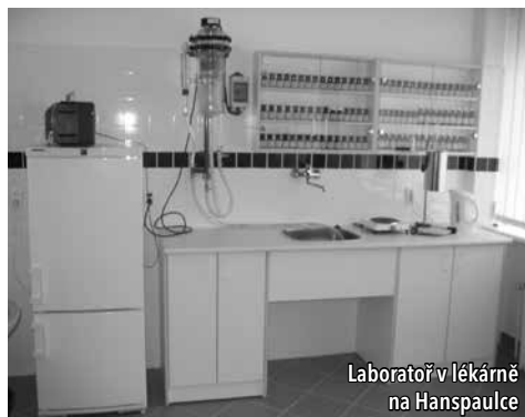
Laboratoř v lékárně na Hanspaulce

Kromě léčiv vázaných na předpis máme i volně prodejné léky a vyrábíme