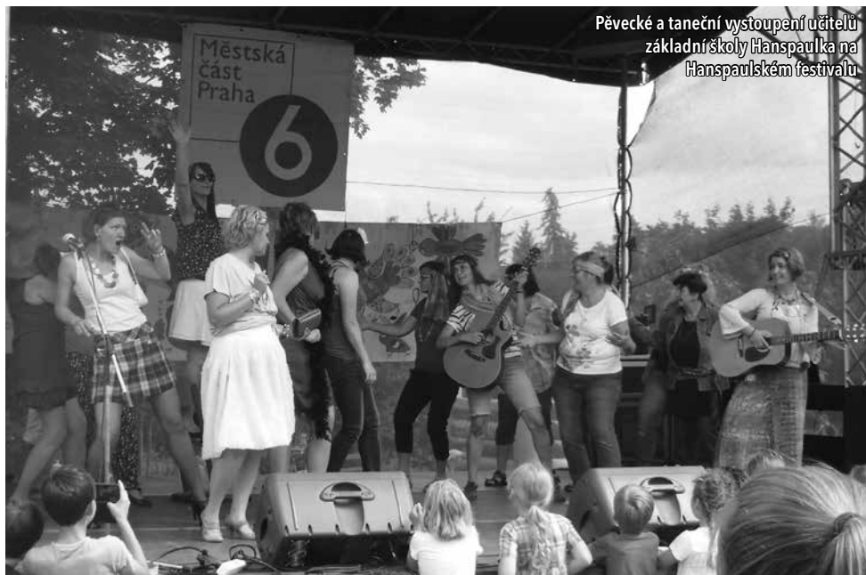
Pěvecké a taneční vystoupení učitelů základní školy Hanspaulka na Hanspaulském festivalu